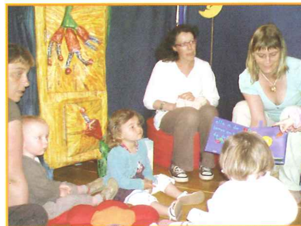
Un moment de partage autour du livre et des lectures avec des tout-petits

Désormais les bibliothèques disposent d'un fond commun de 300 livres répartis entre les 5 structures et le RPAM. Après la petite enfance, les bibliothèques s'associeront vers d'autres projets.